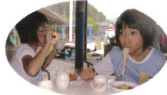
いっぱい食べたよ! ↓流しそうめん→