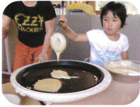
クッキングは お手伝い!