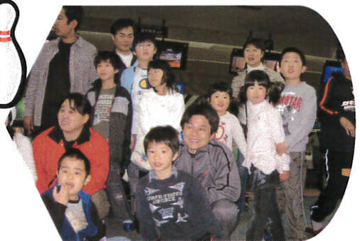
保護者会ボーリング大会