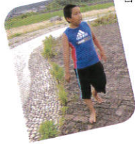
暑い日は水遊びや 水辺公園へ行きました