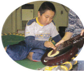
音楽大好き ♪ハートっ子